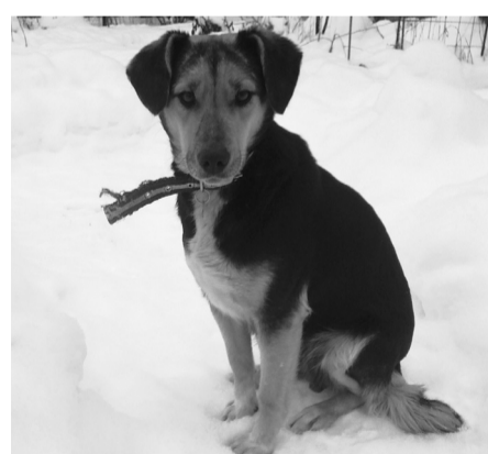
Отдам собаку, Бетти, 1,5 года, привита, стерилизована, спокойно ходит на поводке, рост в холке 45 см, не крупная т. 8-926-895-83-22