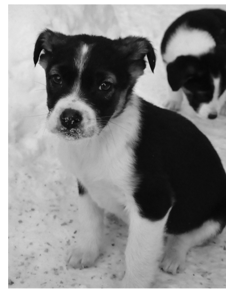
Отдам щенка, Тома, 3 мес., привита, в надежные руки т. 8-926 895-83-22