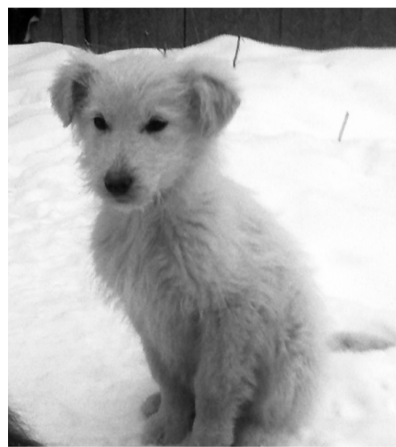
Отдам щенка, Боня, 3 мес., вырастет среднего размера т. 8-926-895-83-22