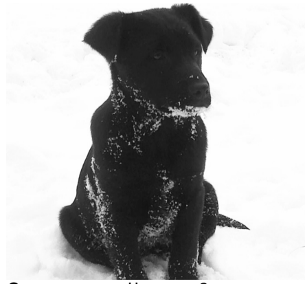
Отдам щенка, Черныш, 3 мес., привит, вырастет среднего размера т. 8-926-895-83-22