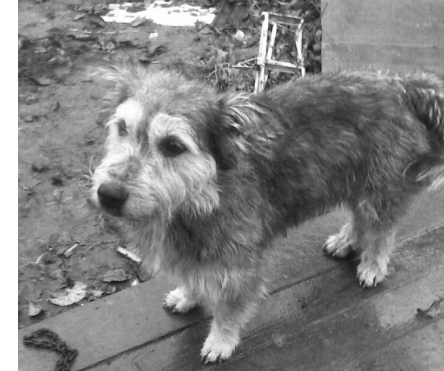
Отдам собаку, Малыш, 2 года т. 8-926-895-83-22

1 февраля в районе завода «Энергомаш» пропала собака по кличке РЫЖКА, в холке 55 см. Гладкошерстная, ласковая, не агрессивная. Была в ошейнике. Стерилизована и привита. Просьба помочь найти вознаграждение, наеемся на помощь. тел.: 8-926-895-83-22, 8-965-344-78-75