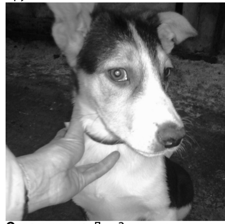
Отдам щунка, Дик, 3 мес., привит, подвижный, озорной, учиться ходить на поводке т. 8-926-895-83-22