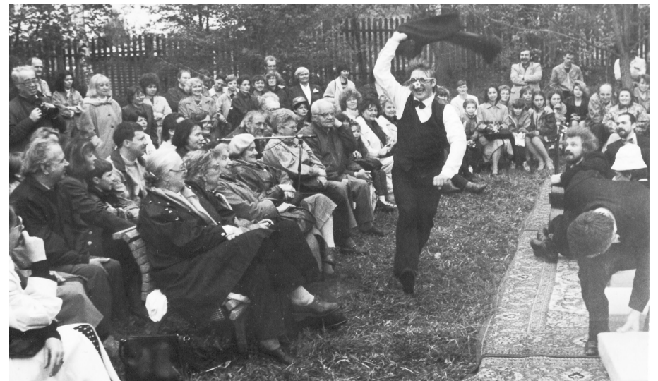
Спектакль липецкого театра - на коврах, постеленных на траве