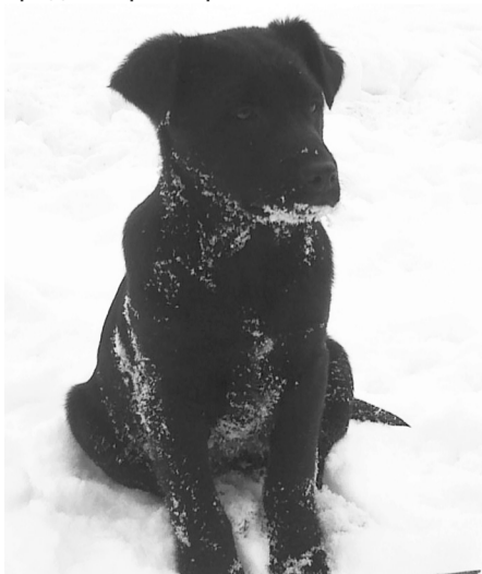
Отдам щенка, Черныш, 3 мес., привит, вырастет среднего размера т. 8-926-895-83-22