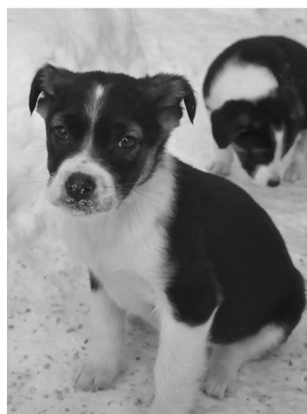
Отдам щенка, Тома, 3 мес., привита, в надежные руки т. 8-926 895-83-22