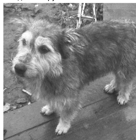
Отдам собаку, Малыш, 2 года т. 8-926-895-83-22