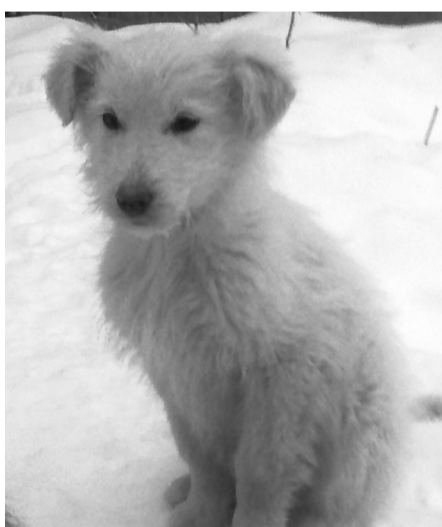
Отдам щенка, Боня, 3 мес., вырастет среднего размера т. 8-926-895-83-22