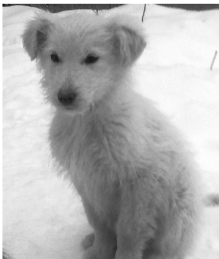
Отдам щенка, Боня, 3 мес., вырастет среднего размера т. 8-926-895-83-22