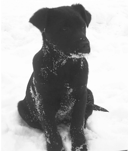
Отдам щенка, Черныш, 3 мес., привит, вырастет среднего размера т. 8-926-895-83-22