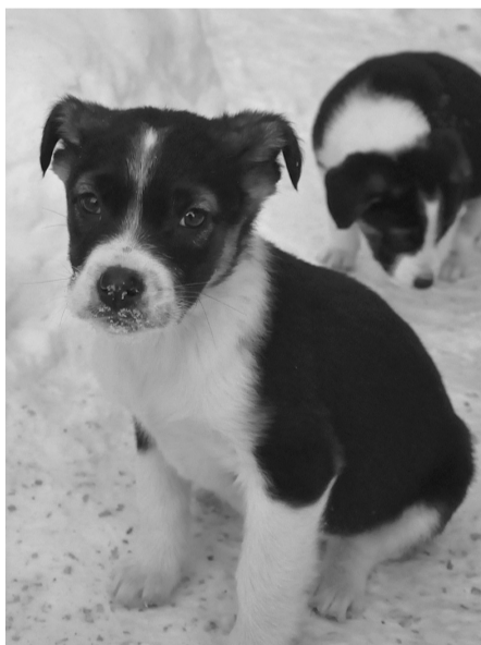
Отдам щенка, Тома, 3 мес., привита, в надежные руки т. 8-926 895-83-22