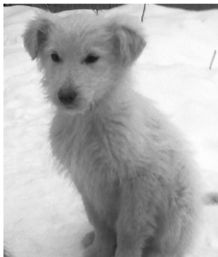
Отдам щенка, Боня, 3 мес., вырастет среднего размера т. 8-926-895-83-22