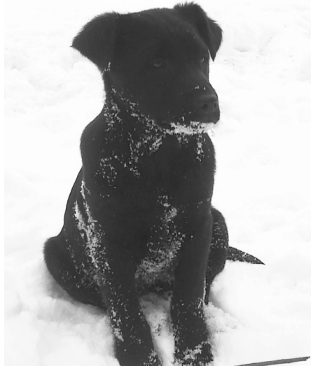
Отдам щенка, Черныш, 3 мес., привит, вырастет среднего размера т. 8-926-895-83-22