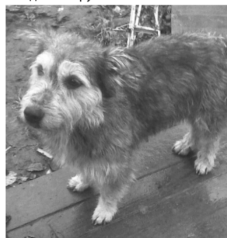
Отдам собаку, Малыш, 2 года т. 8-926-895-83-22