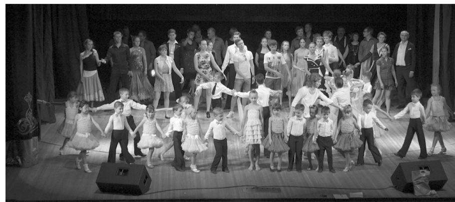
Финал юбилейного концерта