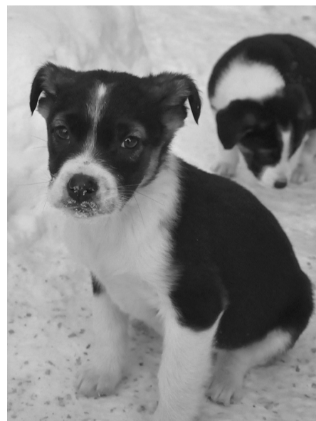
Отдам щенка, Тома, 3 мес., привита, в надежные руки т. 8-926 895-83-22