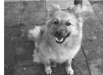
Чарли, 1 год, привита, стерилизованна, тел.: 8-903-128-75-08

Отдам собачку - Лиса, 8 мес., пушистая, некрупная, в холке 40 см т. 8-926-895-83-22