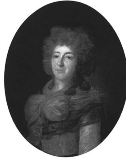
Е. Д. Волконская, бабушка Л.Н. Толстого

И вот что случилось – вернусь к тексту письма П.А. Пожигайло к министру В.Р. Мединскому: «...Не дожидаясь новых Публичных слушаний и утверждения проекта с корректно обозначенной территорией памятника, подлежащего дальнейшему исследованию и защите, на границе памятника были установлены щиты с информацией о распродаже запо-