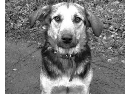
Щенок, метис овчарки, 2 мес., тел.: 8-903-147-46-49, 8-926-895-83-22