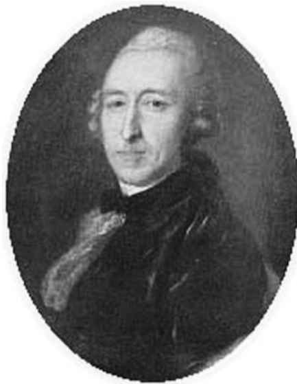
Д.Ю. Трубецкой – прадед Л.Н. Толстого, владелец Прохорова