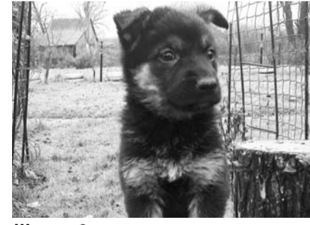
Щенок, 2 мес., вырастет крупным, тел.: 8-903-147-46-49, 8-926-895-83-22