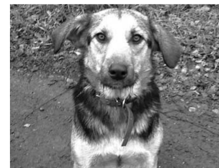
Щенок, метис овчарки, 2 мес., тел.: 8-903-147-46-49, 8-926-895-83-22

Чарли, 1 год, привита, стерилизована, тел.: 8-903-128-75-08