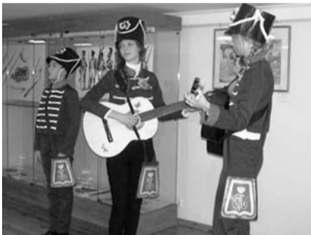
Антон Чехов там бывал.