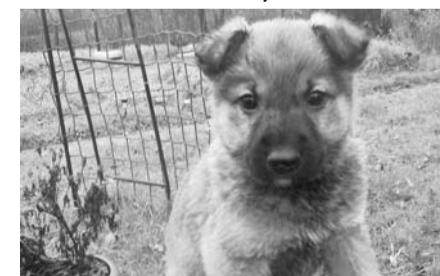
Щенок-девочка, 2 мес., вырастет небольшой, тел.: 8-926-895-83-22