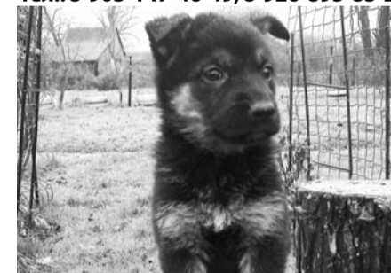
Щенок, 2 мес., вырастет крупным, тел.: 8-903-147-46-49, 8-926-895-83-22