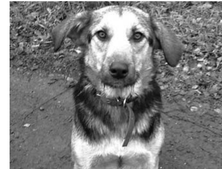
Щенок, метис овчарки, 2 мес., тел.: 8-903-147-46-49, 8-926-895-83-22

Чарли, 1 год, привита, стерилизованна, тел.: 8-903-128-75-08