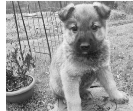
Щенок-девочка, 2 мес., вырастет небольшой, тел.: 8-926-895-83-22