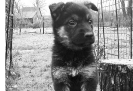
Щенок, 2 мес., вырастет крупным, тел.: 8-903-147-46-49, 8-926-895-83-22