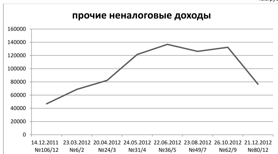
Динамика изменения прочих неналоговых доходов Чеховского муниципального района в 2012 году (сведения по данным решений Совета депутатов) представлена в диаграмме №3 тыс. руб.